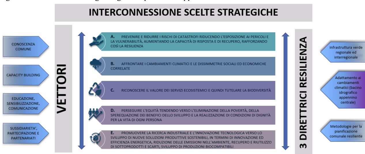
Figura. Struttura della Strategia Regionale per lo Sviluppo Sostenibile

La SRSvS individua un percorso incrementale che favorisca il dialogo con il DEFR nel rispetto delle distinte finalità, considerando che il DEFR è base per la programmazione finanziaria e rappresenta lo snodo di interconnessione fra il Programma di governo e il Bilancio esprimendo strategie e modalità di perseguimento. La Strategia, in sintesi, individua cinque scelte strategiche, affiancate dai vettori di sostenibilità, declinate in 19 obiettivi per i quali sono state individuate le azioni che concorrono alla loro realizzazione. Inoltre ha sviluppato un focus particolare sul tema della resilienza territoriale per il quale ha individuato tre direttrici di sviluppo.