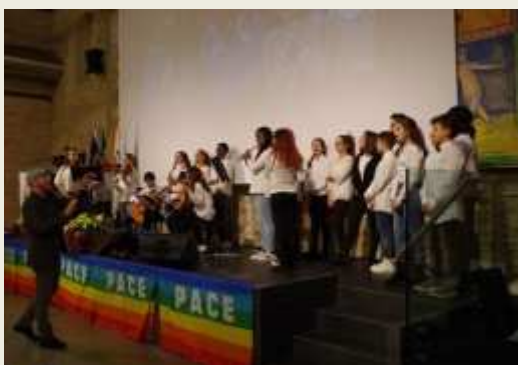
Il coro e l'orchestra dell'Istituto comprensivo "Federico II" di Jesi